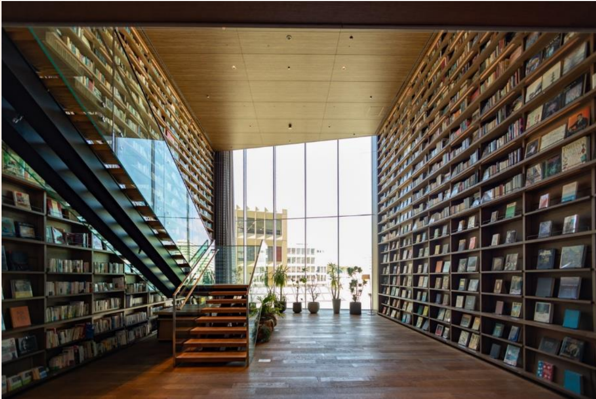
4F イベントスペース